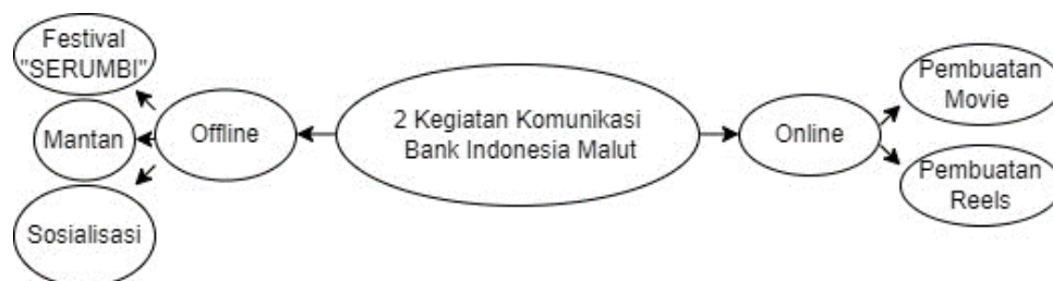
Gambar 2. Kegiatan komunikasi Bank Indonesia Maluku Utara

Kegiatan atau acara tertentu mengenai Qris bisa menambah pengguna layanan Qris hal ini terbukti dengan QRIS Fun Run yang diselenggarakan oleh Bank Indonesia Perwakilan Provinsi Maluku Utara tersebut diikuti 500 peserta dari Pegawai Bank Indonesia, Mahasiswa, Pelajar Sma, TNI, Polri dan Umum untuk menyosialisasikan pentingnya penggunaan layanan pembayaran digital QRIS sekaligus menginspirasi masyarakat untuk menerapkan gaya hidup sehat dan aktif. Selain itu, Bank Indonesia juga membuat konten-konten mengenai Qris yang dibalut dengan komedi serta menyesuaikan budaya sesuai dengan budaya Maluku Utara khususnya Kota Ternate dengan menggunakan bahasa sehari-hari sehingga hal ini dapat dimengerti dan lebih mudah dipahami.