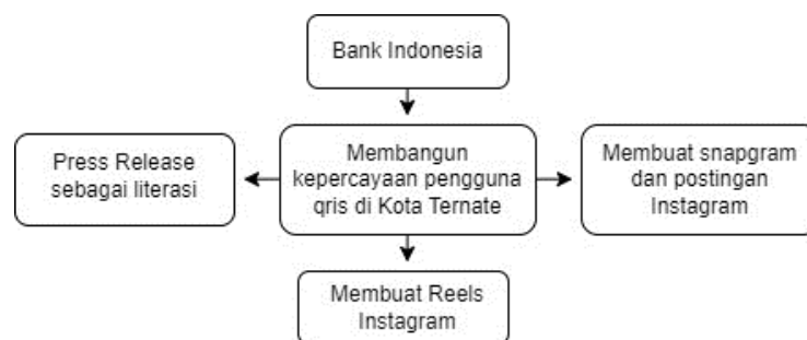
Gambar 1. Membangun kepercayaan pengguna

Semua upaya yang dilakukan ini bertujuan untuk membangun dan memelihara kepercayaan pengguna terhadap QRIS sebagai metode pembayaran yang andal, aman, dan efisien di Indonesia. Dengan demikian, QRIS dapat berkembang dan menjadi salah satu alat pembayaran utama dalam ekosistem keuangan digital Indonesia.