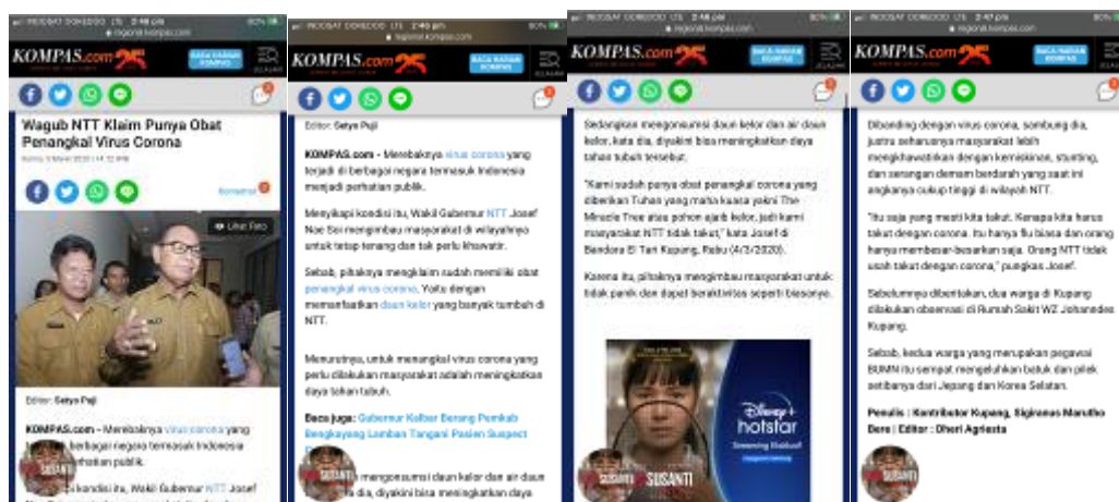
Gambar 3. Berita 3