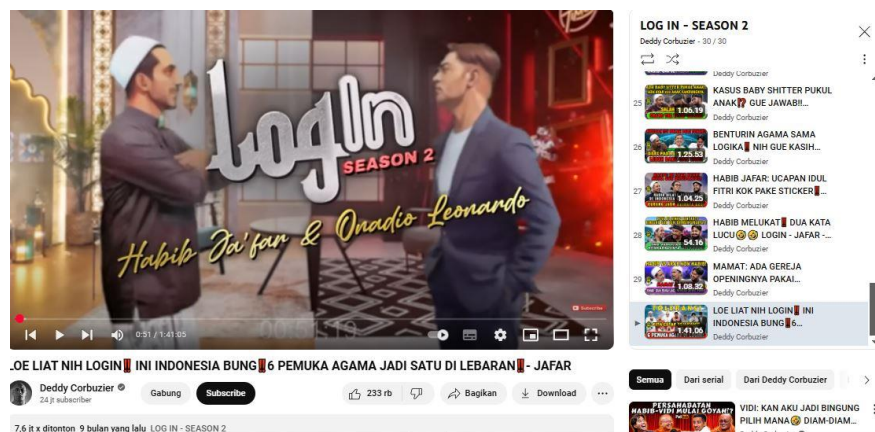
Gambar 3. Podcast LogIn Season 2